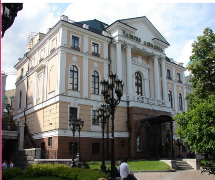
Картинная галерея А.Шилова в Москве

Для размещения коллекции был выделен особняк в историческом центре Москвы рядом с Кремлем, построенный в начале XIX века по проекту известного русского архитектора Е.Д. Тюриня. Торжественное открытие галереи состоялось 31 мая 1997 года. Созданная в соответствии с высочайшими духовными потребностями зрителя, с уважением и любовью к нему, она с первых дней жизни стала необыкновенно популярной и чрезвычайно посещаемой. С момента открытия, ее посетило свыше миллиона человек.