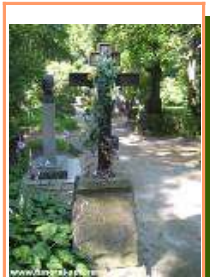
Могила Н.С. Лескова

В последние годы свои Лесков и жил с Варей, с горничной Еленой и старой стряпухой Пашеттой. Но в доме всегда было многолюдно. Постоянно навещали Лескова друзья, собирались молодые писатели, журналисты.