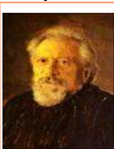
С. Д. Лесков, отец писателя

Это признание было поистине выстрадано писателем, прожившим сложную жизнь, полную тревог и ошибок, испытаний и потерь.