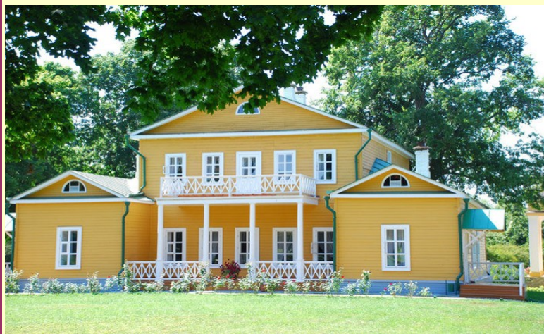
Дом, в котором прошло детство М. Лермонтова

огорчения и даже радости. Спасала природа родных тарханских мест. Она смирляла тревогу в его душе. Давала ту гармонию, которой недоставало в жизни.