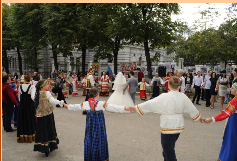
Обломовский фестиваль 2012

23 сентября 2012 г. в Ульяновске состоялся IX «Обломовский фестиваль», посвященный 200-летию со дня рождения И.А.Гончарова. Он проходил на площади им. В.И.Ленина, на бульваре Новый Венец. Впервые «Обломовский фестиваль» проводился одновременно с I Межрегиональным фестивалем