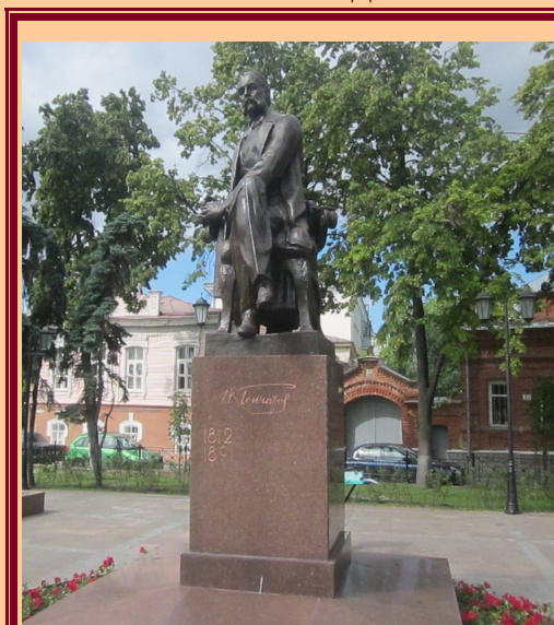
Памятник И.А. Гончарову