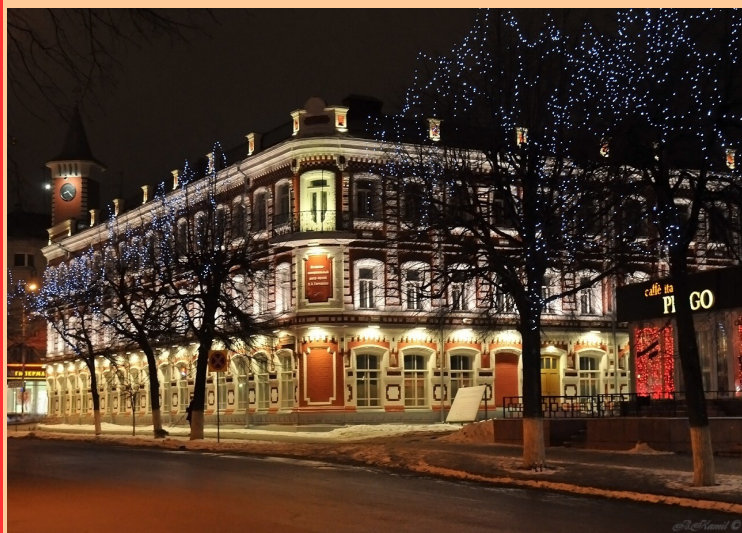
Историко-мемориальный центр И.А. Гончарова

центр, торжественный зал, конференц-зал, литературное кафе. Главным событием торжественных мероприятий явилось открытие Дома -музея Ивана Гончарова после ремонта и глобальной реконструкции. Ивана Гончарова можно увидеть не только на портретах, но и «вживую» – сцены из его жизни транслируются на экранах.