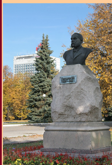
бюст И.А Гончарова

Вспомним еще об одном памятнике нашему земляку, установленному раньше, в 1948 году, сразу после войны, когда наш город отмечал свой 300 летний юбилей. Бюст И.А. Гончарова установлен на гранитном постаменте, ранее принадлежавшем открытому 1 сентября 1913 г. памятнику-бюсту П.А. Столыпину, по проекту скульптора Э. Хименеса, снесённого с