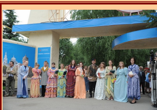
Гончаровский праздник в Винновской роще