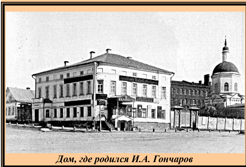
Дом, где родился И.А. Гончаров

угловой дом, но в значительно измененном и перестроенном виде. Дом сильно пострадал во время августовских пожаров 1864 г.