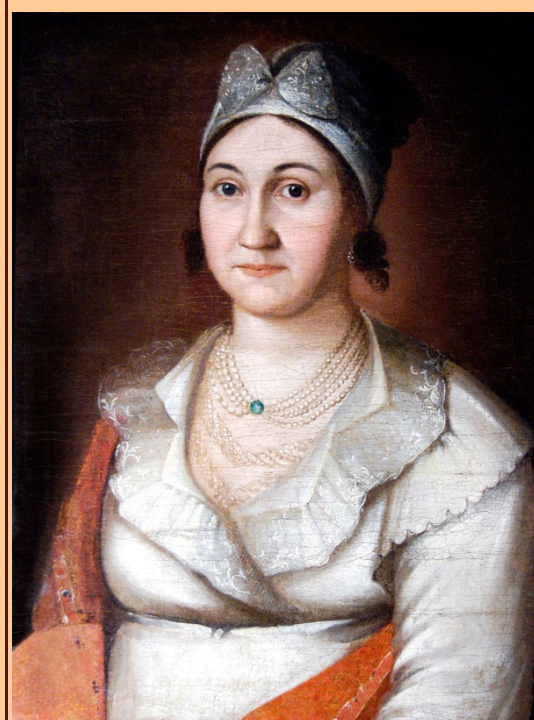
Портрет А.М. Гончаровой