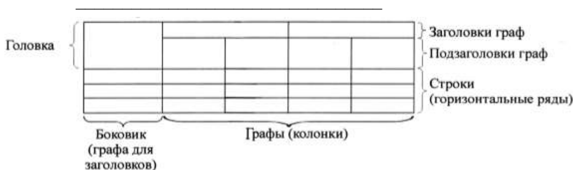
Рисунок 2 – Пример оформления таблицы

8.3.2. Таблицу следует располагать непосредственно после текста, в котором она упоминается впервые, или на следующей странице.